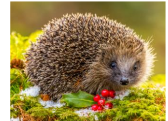
Igel ( Erinaceus europaeus ) Wildtier des Jahres 2024

Kontaktadressen: www: bund.net/hochrhein