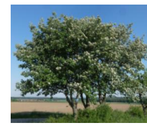
Mehlbeere ( Sorbus aria ) Baum des Jahres 2024